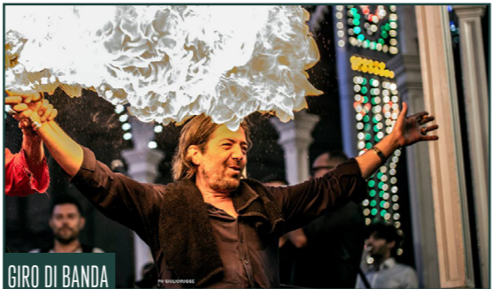
GIRO DI BANDA