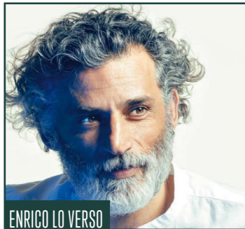
ENRICO LO VERSO