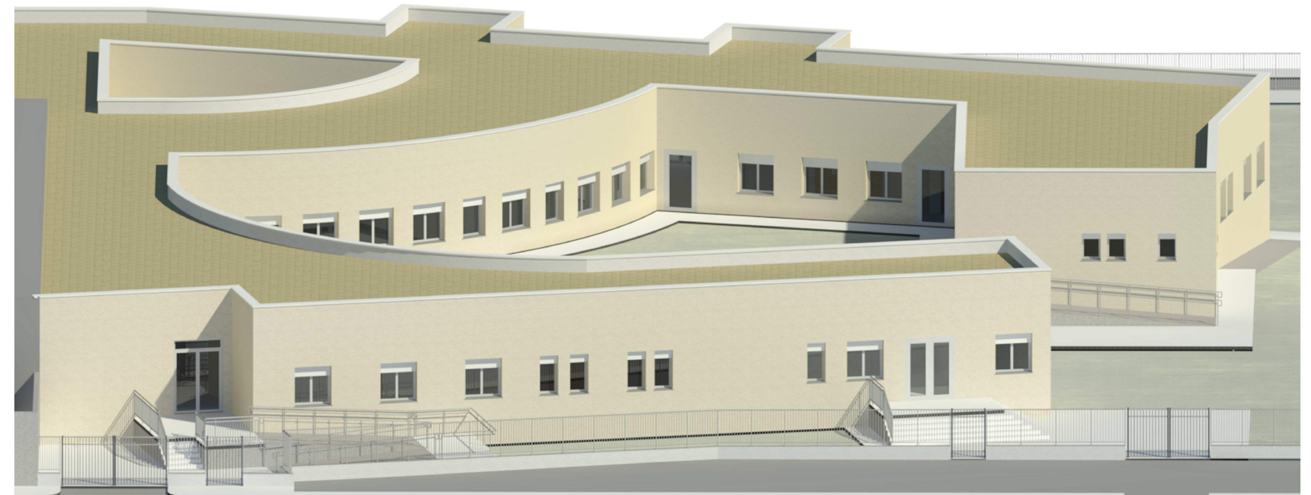
Vista su accesso secondario