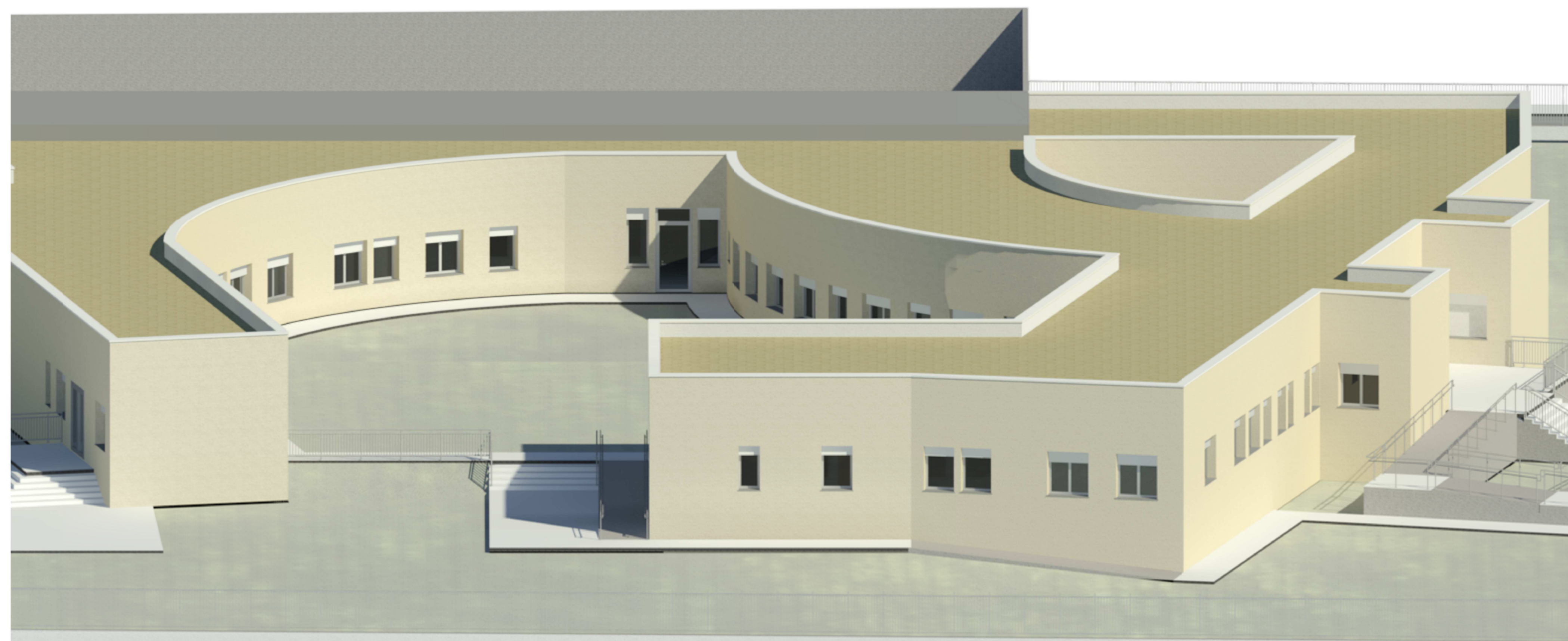
Vista su prospetto sud-est