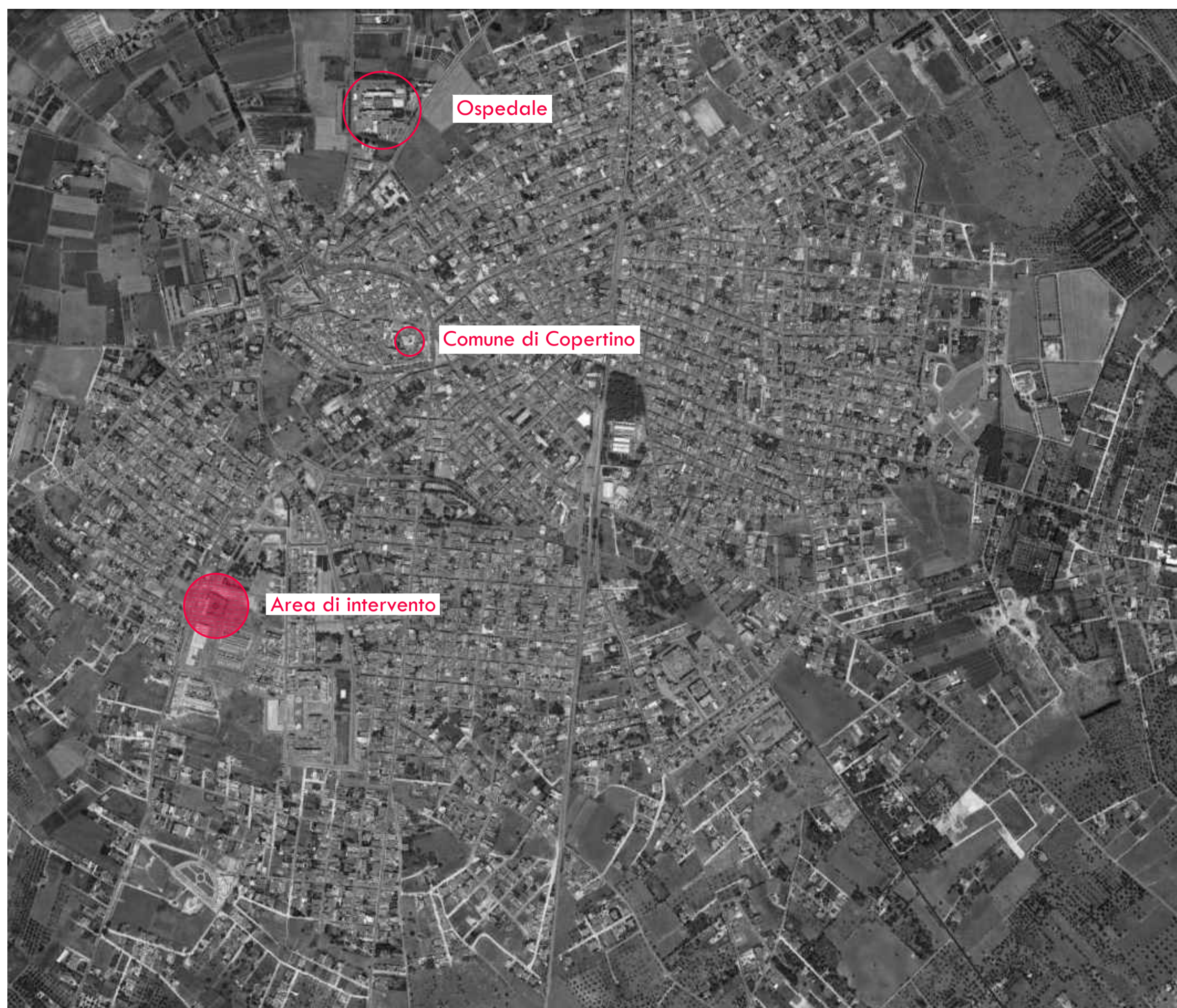
Vista aerea su scala urbana - area di intervento