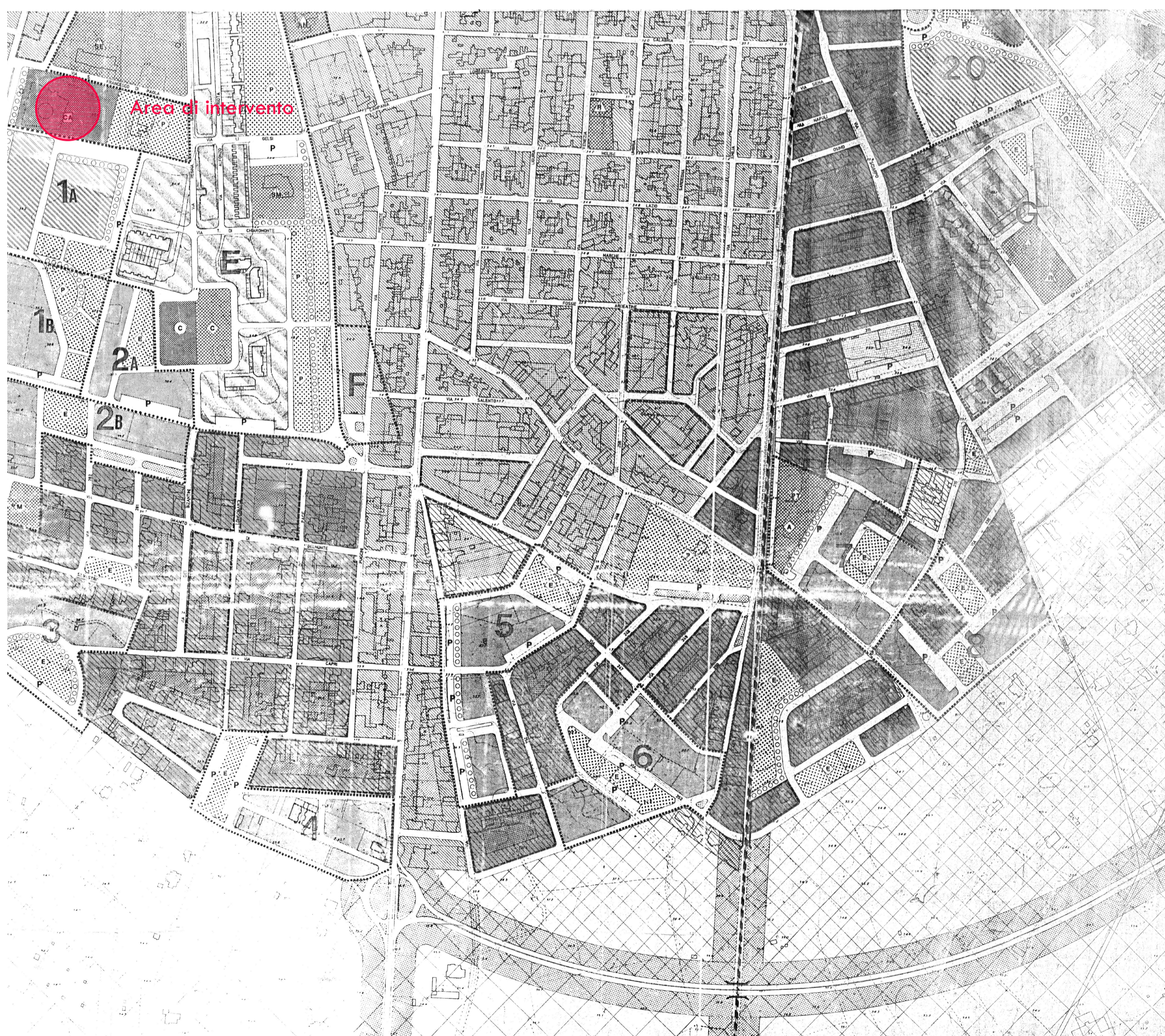
Stralcio PRG - scala 1:5000

L'area di intervento ricade nel NCEU di Copertino al F. 41 p.lle 8 - 831 - 830 - 825 e 650 ed è tipizzato nel vigente Piano Regolatore Generale di Copertino come zona a servizi (F) - ATTREZZATURE E SERVIZI DI INTERESSE GENERALE