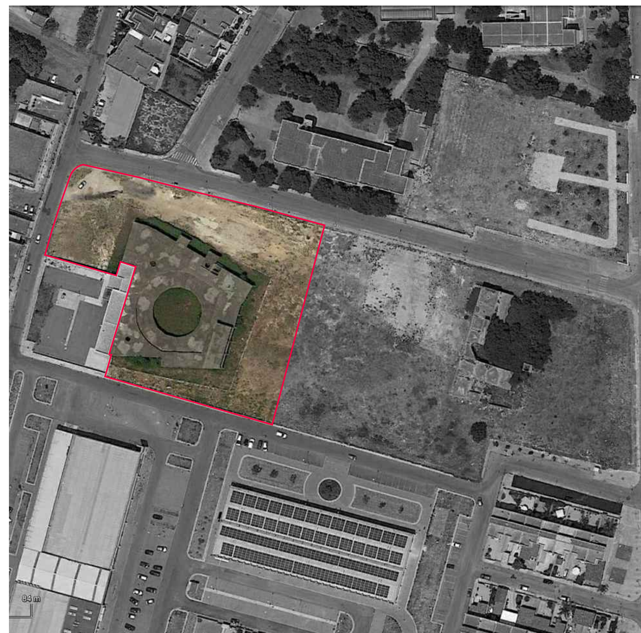
Vista aerea - zoom area di intervento